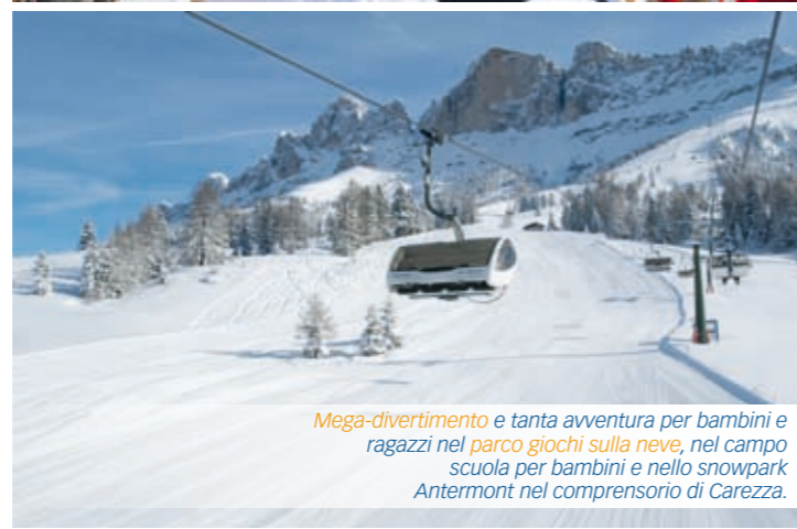
Mega-divertimento e tanta avventura per bambini e ragazzi nel parco giochi sulla neve, nel campo scuola per bambini e nello snowpark Antermont nel comprensorio di Carezza.

20 minutes north of Bozen in the sunny South Tyrol skiing region, with 16 lift systems, 40 km of slopes and a fantastic view of the Dolomites in King Laurin's realm, Rosengarten and Latemar. From December 2008, there will be 3 new lift systems, new skiing slopes and 170 snow cannons to guarantee snow from December to April in the awe-inspiring Carezza skiing region of the Dolomites.