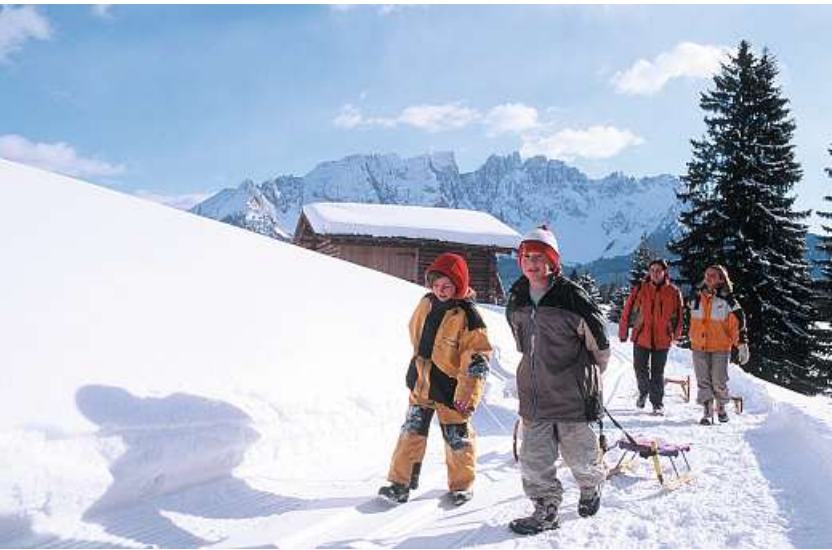
Printed in Italy by ©GEMME poster - febbraio 2012