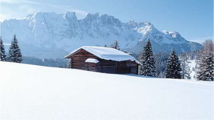
Elisabethpromenade, Blick auf das Elisabethdenkmal

Alternativ: Start in Welschnofen-Posthotel (1.200 m) - Weg Nr. 7 bis Meierei